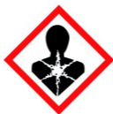
Danger pour la santé