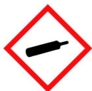
Gaz sous pression