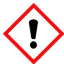
Nocif ou irritant